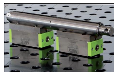
Adequat per material rodó