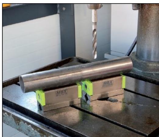
Adequat per foradar, rectificat, soldar...fixant a la taula de la màquina mitjançant un gir de clau.