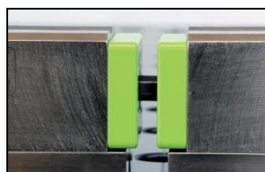
Possibilitat d'allargar varis MBX