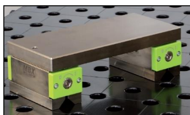
Adequat per material pla